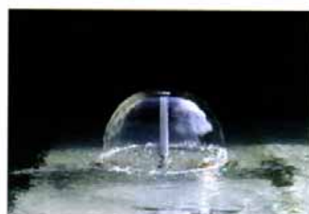
マッシュルーム形

水を流体としてではなく、霧や蒸気として表現したもの。噴霧の粒子が10〜20ミクロン程度で衣服や肌が湿る心配のないものもある。写真は粒子の粗いもの。