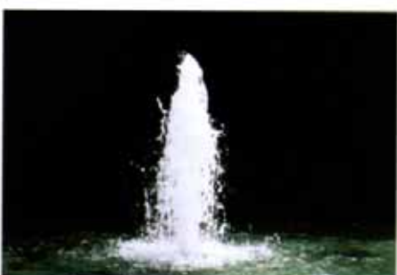
キャンドル形(樹氷形)

右のキャンドル形はノズルが水面下に没しているが、本写真はノズル先端が水面上に首を出したもの。